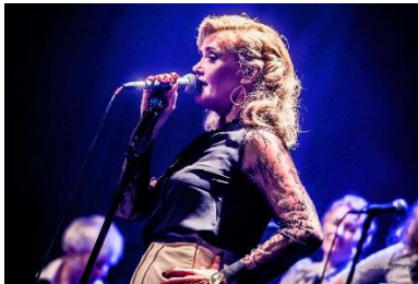
Etta James Experience